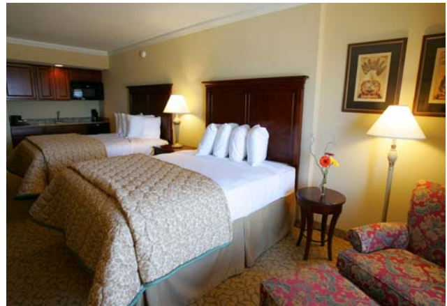
Hotelroom mit Double Beds