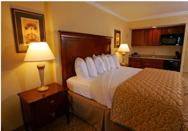
Hotelroom mit King Bed